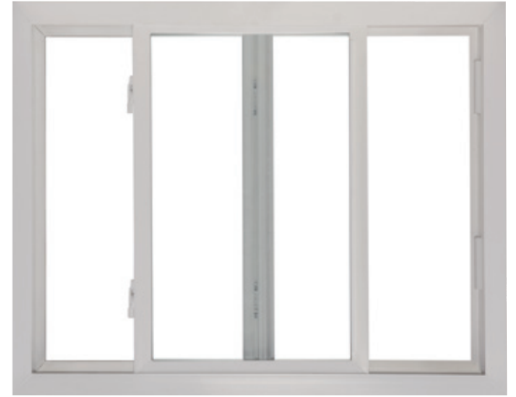
Ventana corrediza con 2 vidrieras y bisagra frontal