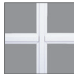
Armazones planos de 5/8" o 3/4" y contorneados de 5/8" o 1" disponibles