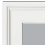
Exterior de moldura de ladrillo