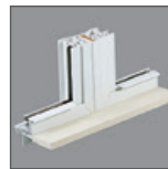
Elija la extensión de la jamba de madera y montaje de fábrica para facilitar la instalación, sin mano de obra o materiales adicionales