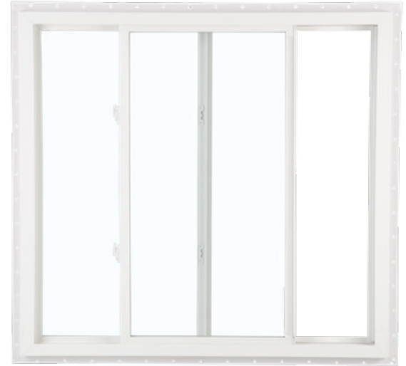
Ventana deslizante de 2 vidrieras