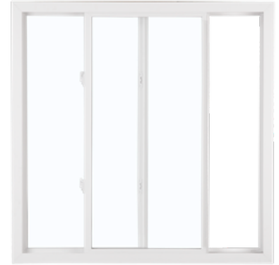
Ventana deslizante de 2 vidrieras