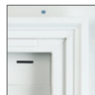
Moldura de ladrillo con canal en J