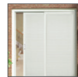
Controla la luz y la privacidad