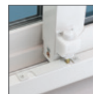
Cerradura con sistema de bloqueo con perno