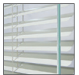
Nunca necesita sacudirse y es segura para las mascotas y los niños