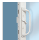
Cerradura de punto doble (estándar)