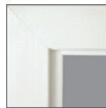
Carcasa plana de 3 1/4" con borde redondeado