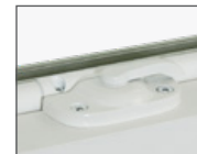
Incluye nuestra nueva cerradura de bajo perfil