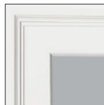
Exterior de moldura de ladrillo