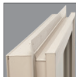
Acabados enclavados pretoquelados y canal en J integrado