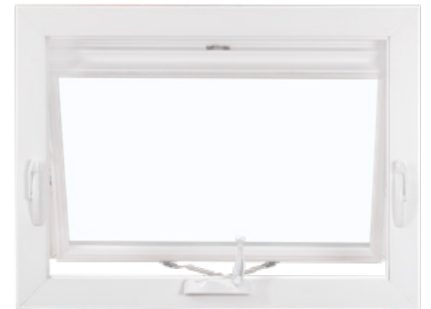
Marquesina con ventilación simple