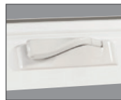
Manija plegable elegante