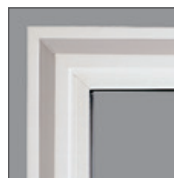
El atractivo borde biselado brinda un encanto clásico