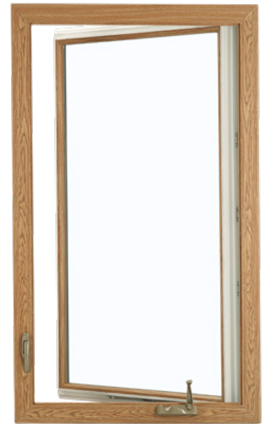
Marco giratorio con ventilación simple